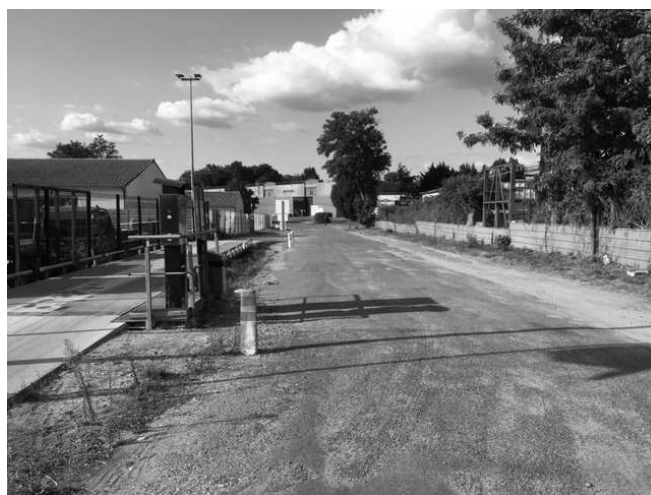
Route transversale traversant la zone. Au fond, PAPREC.

La directrice de l'entreprise et la vice-présidente chargée des déchets affirment qu'il y a eu beaucoup de communication auprès des collectivités et des administrés. Certains écrasent la bouteille et les rebouchent après. D'autres jettent la bouteille et récupèrent le bouchon. A Illats, il y a des récupérateurs de bouchons à l'école et à la salle de sports. Ils sont ensuite amenés bénévolement au centre de collecte du Passage d'Agen. (Note de la rédaction : la CDC pourrait-elle ouvrir un nouveau point de collecte à la déchetterie de Virelade ?)